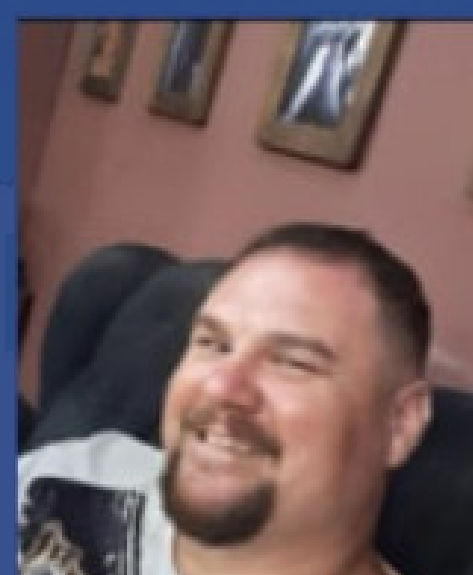
DARTTA TREINADOR SUB 17