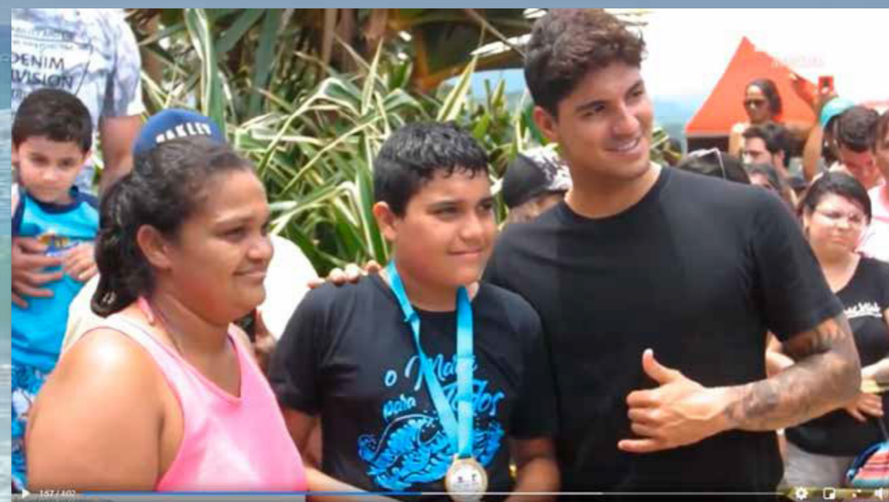
Onda Azul no Instituto Gabriel Medina ~ Mundo Medina, Canal OFF