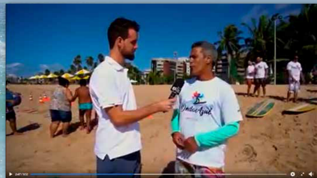
Aula Inaugural em Maceió ~ Esporte Campeão