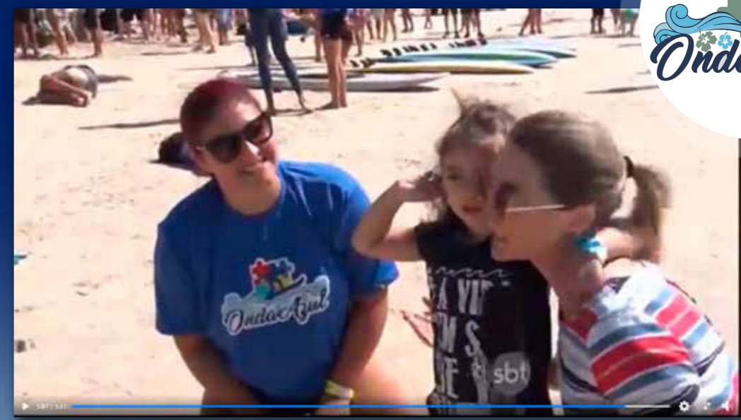
1º Festival de Surf Onda Azul ~SBT Meio Dia