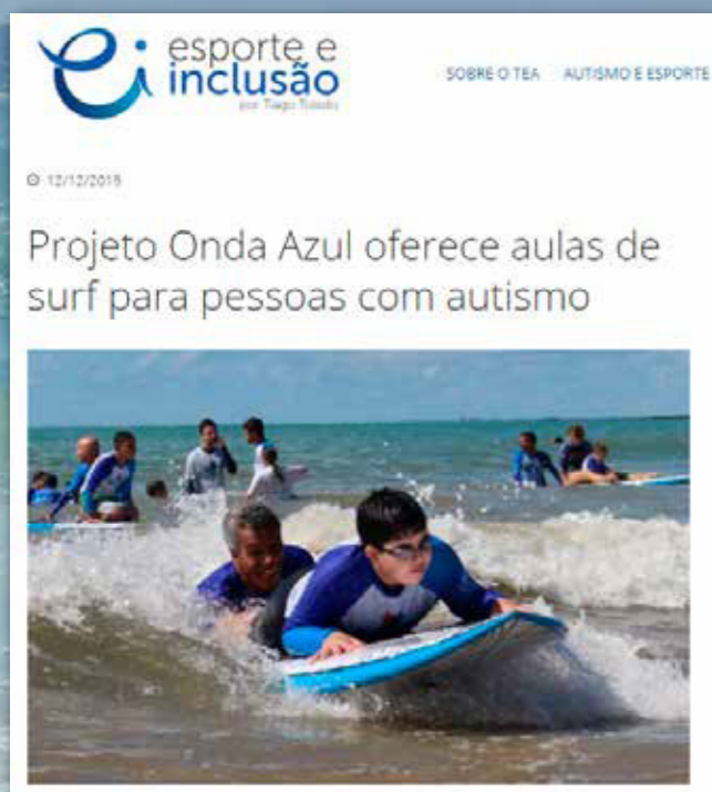
Reportagem em site especializado